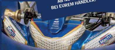
MACH1 KZ / OK / X30 / ROTAX

NEUE HOMOLOGATION 2022 AB NOVEMBER BEI EUREM HÄNDLER!