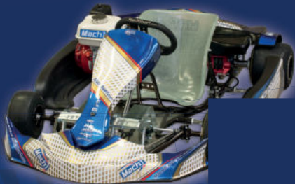
MACH1 JS1 JUGEND- UND SLALOMKART (JS1-E ELEKTROKART AUF ANFRAGE)